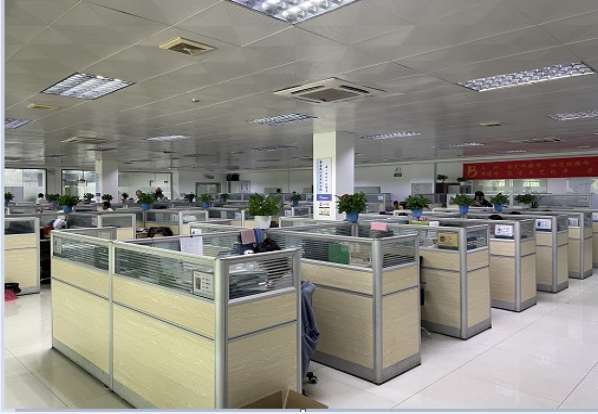
桃子园-综合办公室