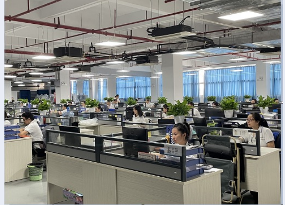
新基地-综合办公室